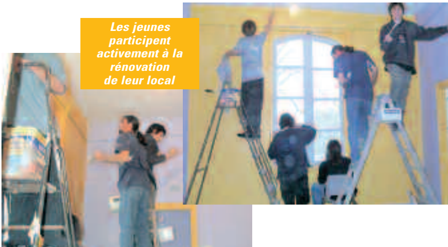
Les jeunes participent activement à la rénovation de leur local