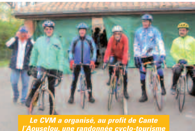
Le CVM a organisé, au profit de Cante l'Aouselou, une randonnée cyclo-tourisme

accueille des personnes handicapées, quel que soit le handicap et quel que soit l'âge, accompagnées de leurs éducateurs ou encadrants.