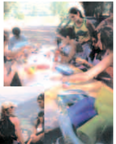
Les ados: pendant les camps d'été