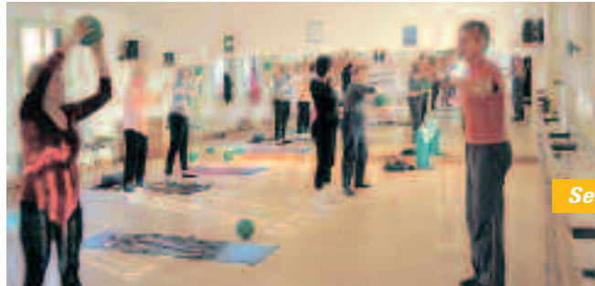
Section Gym seniors