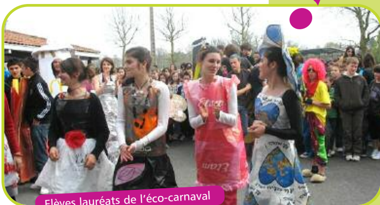
Elèves lauréats de l'éco-carnaval